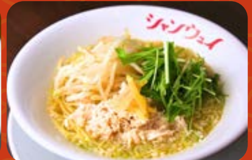
蒸し鶏モやし湯麵