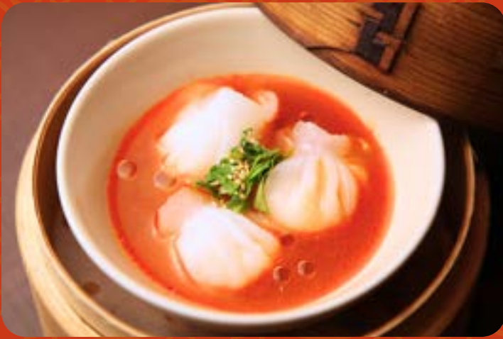
海老水餃子 ビスク風