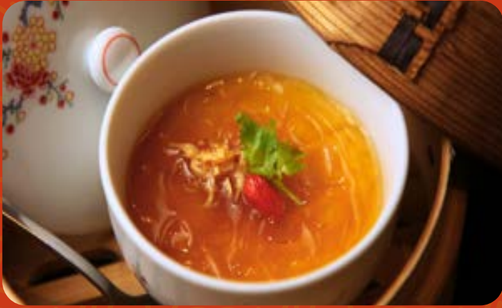
ツカヒレ茶碗蒸し