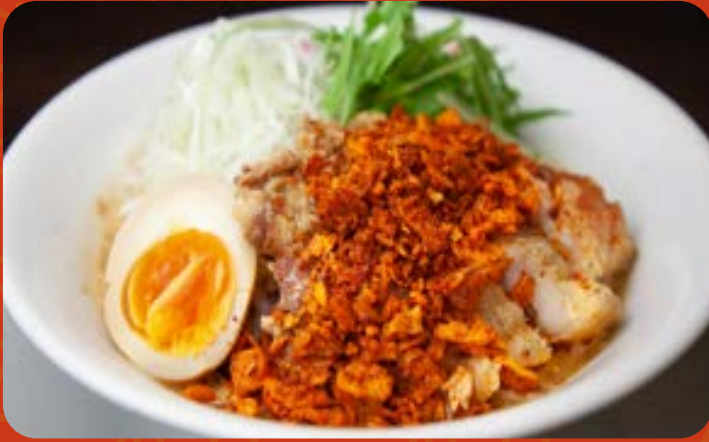
毛沢東スペアリブ 担々麵/醬油そば

Signature Spicy Pork Ribs Noodle Dan-Dan Soup / Soy Base Soup 香味孜然排骨担担面/酱油汤面