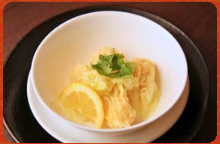
葱塩海老ワンタン