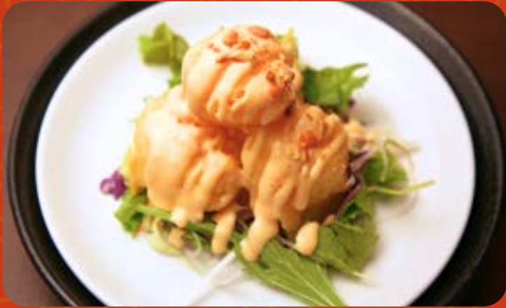
サクサク海老マヨ

Truffle Scented Shrimp & Eggs 黑松露风味虾球炒滑蛋