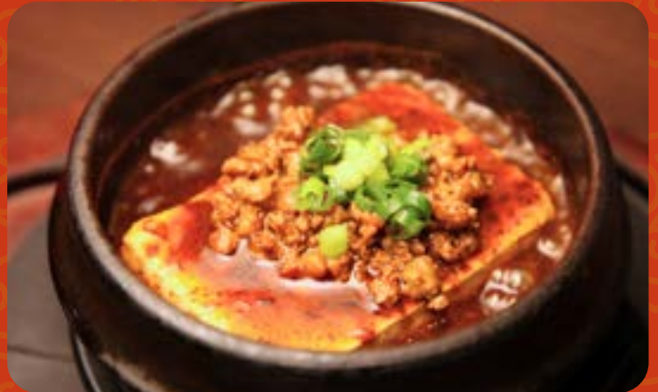
土鍋仕立てのマーボー豆腐

Battered Shrimp with Creamy Mayonnaise 香炸鲜虾配奶油蛋黄酱