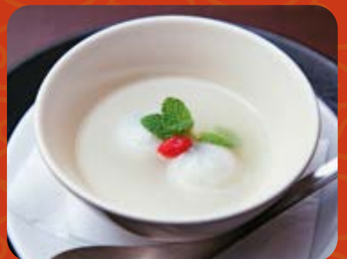
吟醸しらすたま湯圓