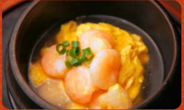
トリュフ香る海老玉炒め