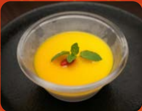
マンゴー杏仁豆腐 ¥580